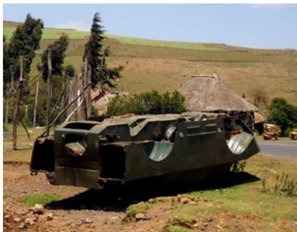
Photo Ethiopie - Le Gouriellec : Les routes du Nord sont jalonnées de carcasses de chars, héritages de la guerre civile.

Une longue guerre civile s'en suit jusqu'à l'arrivée au pouvoir du Front démocratique révolutionnaire du peuple éthiopien (FDRPE) de Meles Zenawi, toujours à la tête de l'Etat.