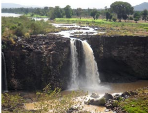
Photo Ethiopie - Le Gouriellec : Les chutes du Nil Bleu. Depuis quelques années l'alimentation d'un barrage détourne une majorité des eaux du fleuve amputant les chutes aux trois quarts.

Copyright texte et photo Le Gouriellec-novembre 2009/diploweb.com