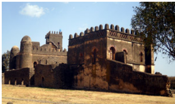
Photo Ethiopie - Le Gouriellec : L'un des châteaux de Gondar, capitale des souverains éthiopiens du XVIIème au XIXème siècle.

L'Ethiopie a aussi une histoire récente violente . Haïlé Sélassié, le dernier représentant de la dynastie salomonide (Ménélik 1er serait le fils du Roi Salomon et de la Reine de Saba) est chassé du pouvoir par Mengistu en 1974.