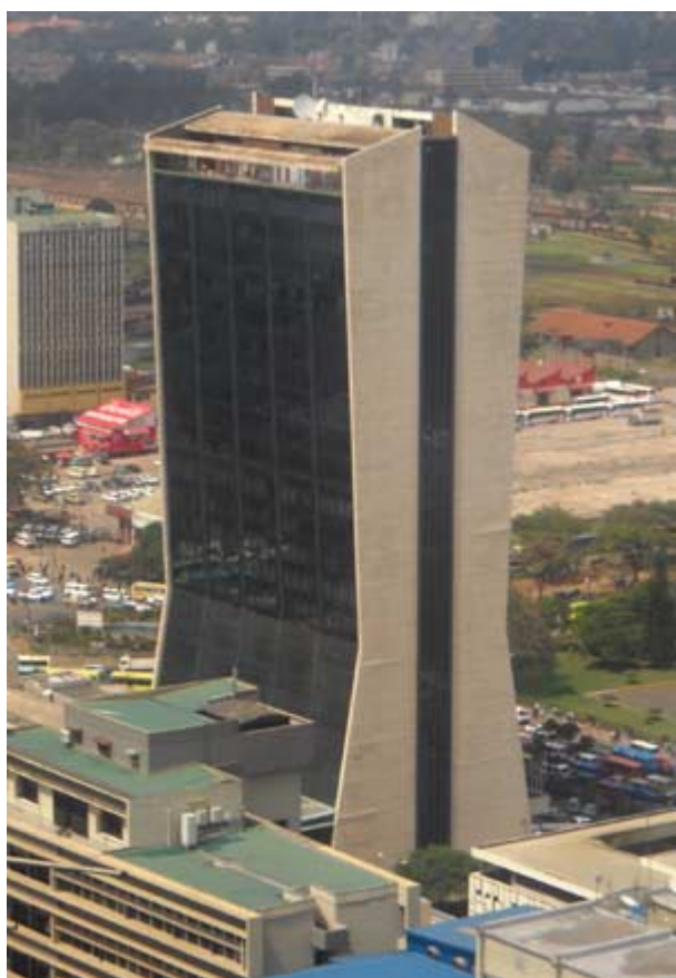
Photo Ethiopie - Le Gouriellec : Ancienne ambassade américaine à Nairobi cible d'un attentat en 1998

L'Ethiopie est au cœur du nouveau grand jeu mené par la Chine et les Etats-Unis en Afrique. Ces derniers craignent de voir une « talibanisation » de la région et soutiennent l'Ethiopie pour mener des interventions armées contre les islamistes Somaliens. La lutte contre le terrorisme a commencé sous Clinton à la suite des attentats du 7 août 1998 contre les ambassades américaines de Dar es Salam et de Nairobi.