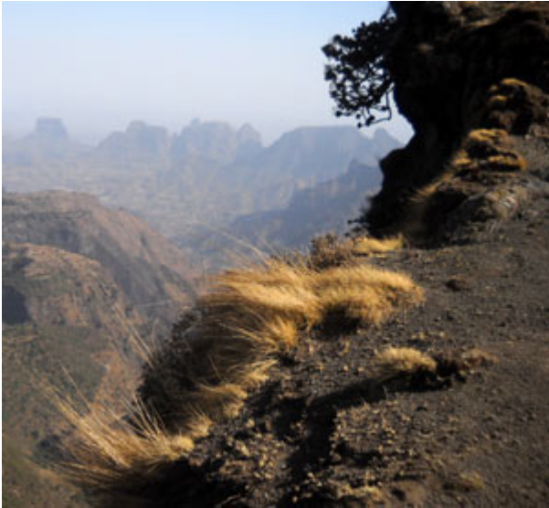
Photo Ethiopie - Le Gouriellec : Vue du Parc National du Simien, dans le Nord, inscrit sur la liste du patrimoine mondial de l'UNESCO