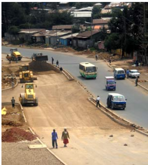
Photo Ethiopie - Le Gouriellec : Travaux dans une rue d'Addis Abeba. Le China Road and Bridge Group (CRBC) a aussi achevé en 2003 le périphérique de la ville.