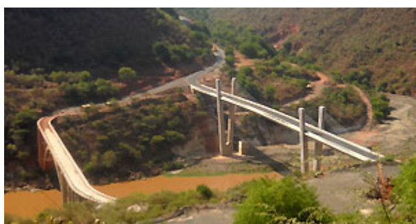
Photo Ethiopie - Le Gouriellec : Dans les gorges du Nil, à gauche le vieux pont bâti par les Italiens (2 véhicules ne peuvent pas s'engager en même temps) et à droite le nouveau pont inauguré en 2010. Ces ponts reliant les provinces du Choa et du Godjam sont stratégiques pour l'économie du pays.

Le Nil Bleu , un des affluents du Nil, prend sa source en Ethiopie. Il est responsable de 85% de son flux. L'irrigation et la production hydro-électrique constituent les principaux enjeux de ce fleuve et la question du partage des eaux du Nil est majeure en Afrique de l'Est depuis des décennies. Le sort de l'Egypte est lié aux décisions prises par les pays en amont. A plusieurs reprises, les tensions entre l'Egypte et l'Ethiopie ont failli dégénérer.