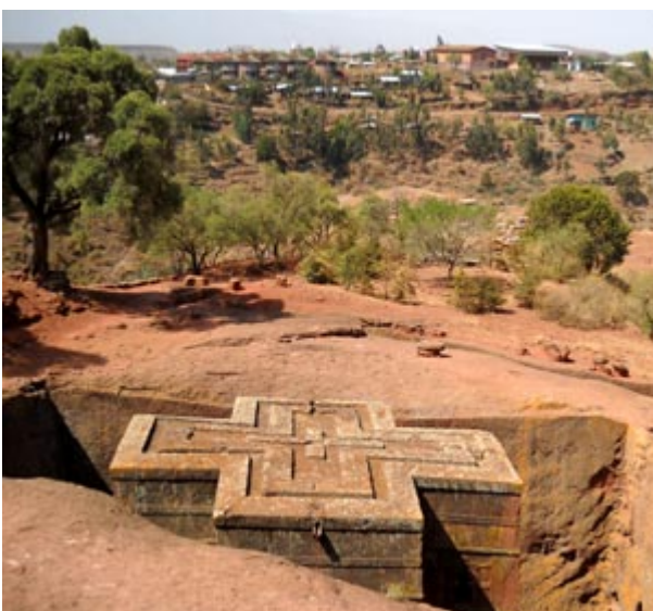
Photo Ethiopie - Le Gouriellec : Beta Giyorgis (la Maison de Saint-Georges), l'une des églises entièrement creusées dans la roche volcanique à Lalibela, aussi appelée la nouvelle Jérusalem.

Ensuite de part son histoire . Seul pays d'Afrique à n'avoir pas été colonisé (victoire de l'empereur Menelik sur les Italiens à Adoua en 1896), ses hauts plateaux abritent l'héritage de l'ancienne Afrique chrétienne (copte). Près de la moitié de la population éthiopienne est chrétienne.