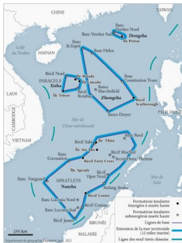
Fig. 2. Les limites probables des « quatre sha » en mer de Chine du Sud selon la terminologie chinoise, d'après le département d'État américain