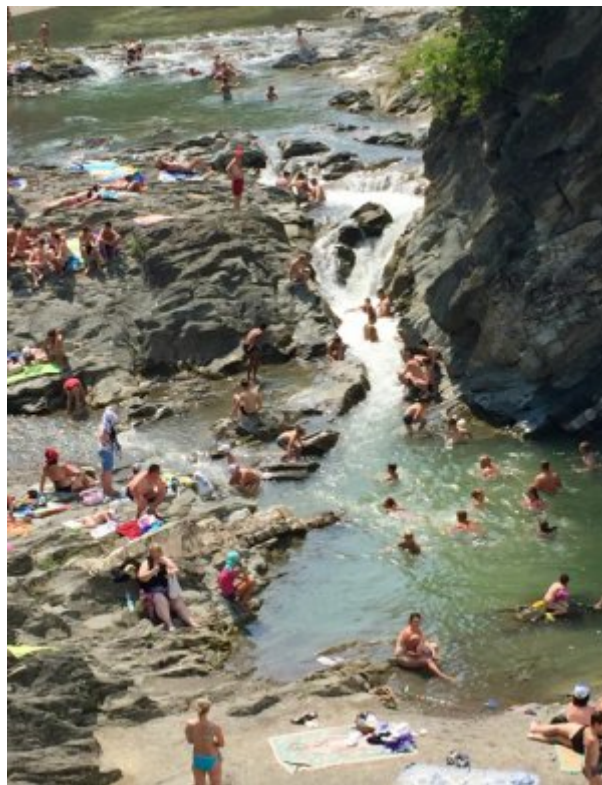
Ukraine, Carpates, les joies du bain dans la rivière

Et pendant ce temps, la vie continue. Mieux remplis qu'à l'époque soviétique, les marchés présentent des scènes récurrentes, comme cette femme âgée qui améliore son ordinaire en patientant dans l'espoir de vendre un pot de confiture maison.