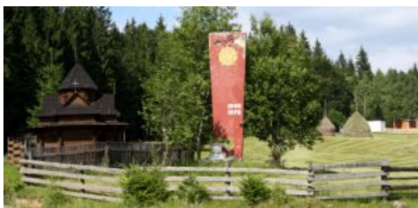
Ukraine, paysage des Carpates.

Résultat, l'Ukraine se présente à la fois comme un pays en guerre et un pays en paix. Du moins avec lui même. Il n'est pas certain que la Russie puisse en dire autant.