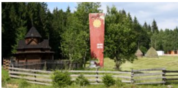
Ukraine, paysage des Carpates.

Résultat, l'Ukraine se présente à la fois comme un pays en guerre et un pays en paix. Du moins avec lui même. Il n'est pas certain que la Russie puisse en dire autant.