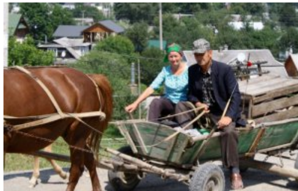
Ukraine, Carpates, retour du marché de Verkhovyna

A l'écart de Verkhovyna, cette maison rurale comme des milliers d'autres semble vivre dans un autre temps, sur un autre rythme.