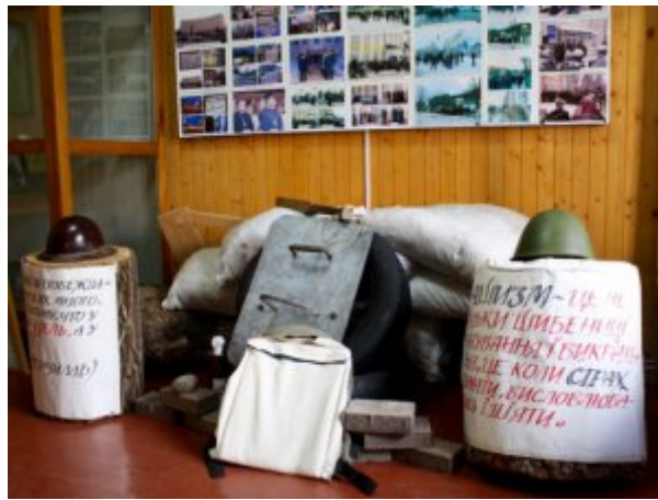
Ukraine, souvenirs des jours révolutionnaires de 2013-2014

Ukraine, le musée ethnographique de Verkhovyna présente une salle entière à propos des journées révolutionnaires de la fin de l'année 2013 et du début de l'année 2014 lorsque nombre d'Ukrainiens ont décidé de se défaire de la tutelle russe dans l'espoir de se rapprocher de l'Union européenne.