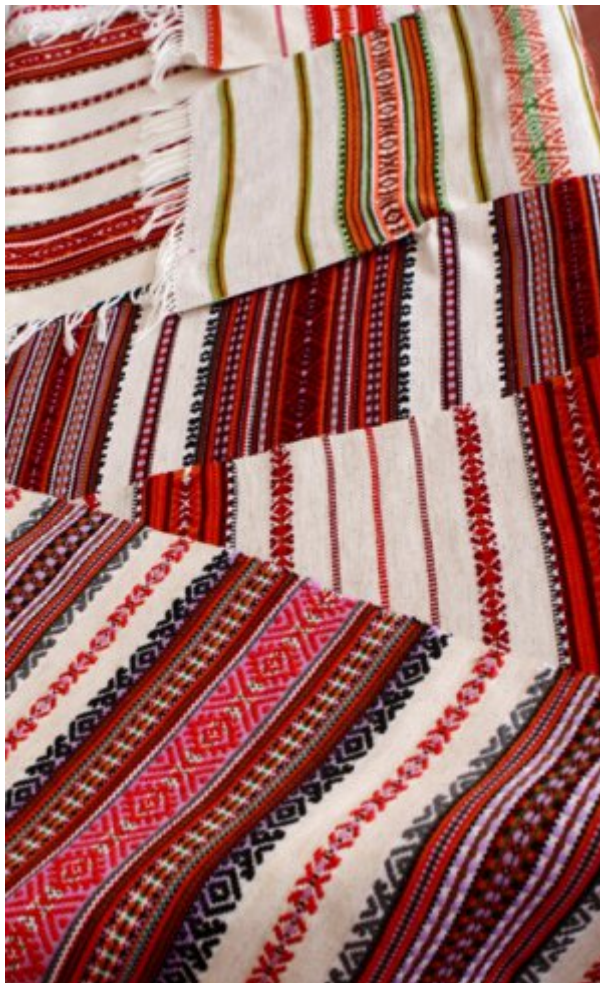
Ukraine, tissages et broderies font partie des traditions

Comme dans beaucoup de pays du monde, cet enfant joue au foot avec son père sur une place à proximité du centre de Lviv, devant le musée des religions.