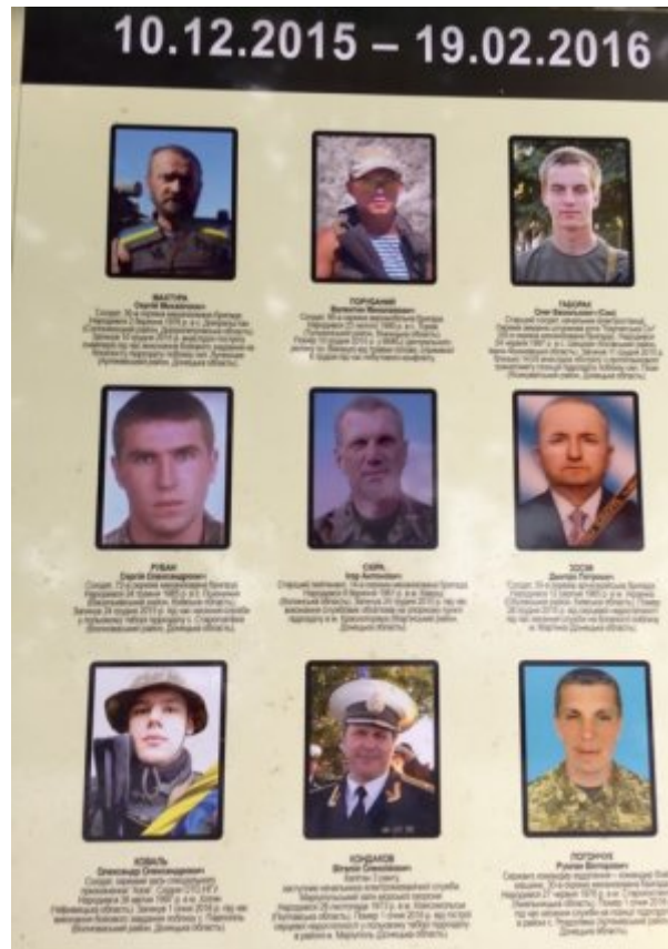
Ukraine, Kiev, photographies d'une partie des combattants ukrainiens morts en 2015-2016

Ukraine, Kiev, non loin du centre un mur de plus d'une trentaine de mètres affiche les photos d'une partie des combattants ukrainiens morts dans les combats contre la Russie depuis 2014. Certaines personnes se signent. Les parents expliquent aux enfants le sens de ces photos.