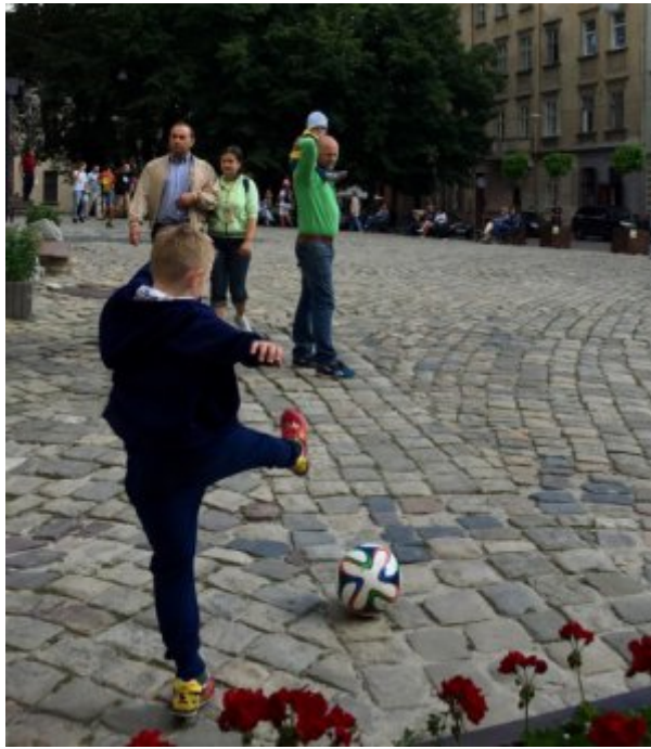
Ukraine, Lviv, scène de la vie quotidienne

Comme dans beaucoup de pays du monde, cet enfant joue au foot avec son père sur une place à proximité du centre de Lviv, devant le musée des religions.