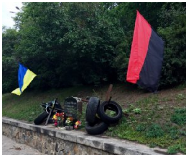
Ukraine, Kiev, monument en souvenir des combats révolutionnaires de 2013-2014

Ukraine, le musée ethnographique de Verkhovyna présente une salle entière à propos des journées révolutionnaires de la fin de l'année 2013 et du début de l'année 2014 lorsque nombre d'Ukrainiens ont décidé de se défaire de la tutelle russe dans l'espoir de se rapprocher de l'Union européenne.