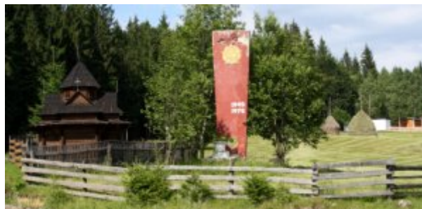
Ukraine, paysage des Carpates.

Résultat, l'Ukraine se présente à la fois comme un pays en guerre et un pays en paix. Du moins avec lui même. Il n'est pas certain que la Russie puisse en dire autant.