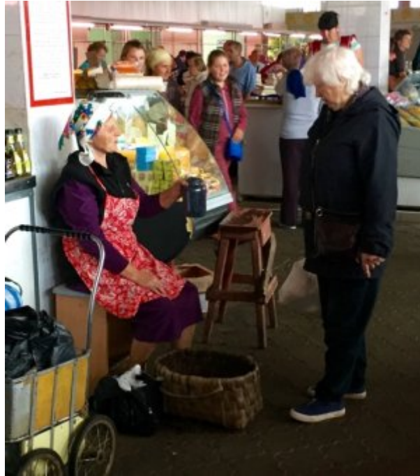
Ukraine, Lviv, marché près de la gare ferroviaire.

Et pendant ce temps, la vie continue. Mieux remplis qu'à l'époque soviétique, les marchés présentent des scènes récurrentes, comme cette femme âgée qui améliore son ordinaire en patientant dans l'espoir de vendre un pot de confiture maison.