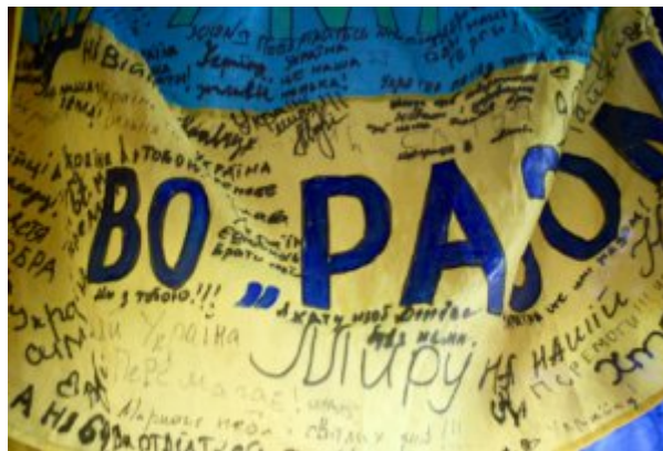
Verkhovyna, musée ethnographique, drapeau ukrainien avec des écrits de révolutionnaires de 2014

Cette photographie, plus insolite, témoigne d'une forme de détermination. Pour autant la guerre n'a rien de romantique.