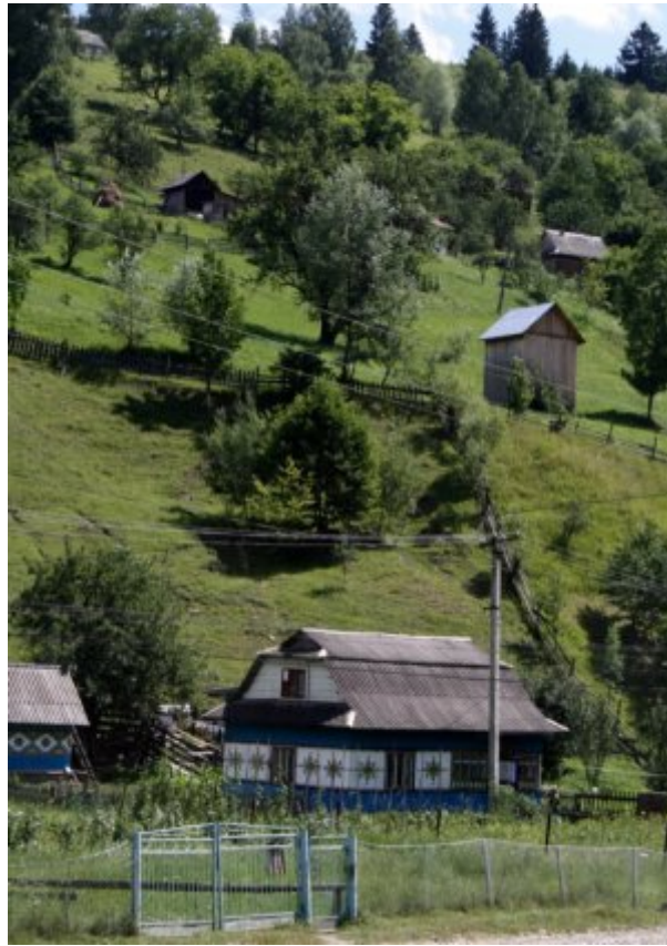
Ukraine, Carpates, environs de Verkhovyna, maison rurale

A l'écart de Verkhovyna, cette maison rurale comme des milliers d'autres semble vivre dans un autre temps, sur un autre rythme.