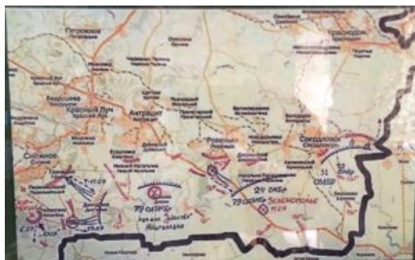
Ukraine, extrait de carte du front oriental où la Russie soutient une guerre hybride

Ukraine, Kiev, à proximité de la place Maïdan et du parc Yevpropeiska, un monument à la mémoire des victimes de la répression lors des combats révolutionnaires de 2013-2014. Au centre, une stèle et des restes de barricades. A gauche le drapeau ukrainien (bleu et jaune). A droite, le drapeau de l'armée insurrectionnelle ukrainienne, c'est-à-dire le drapeau de la résistance durant la Seconde Guerre Mondiale.