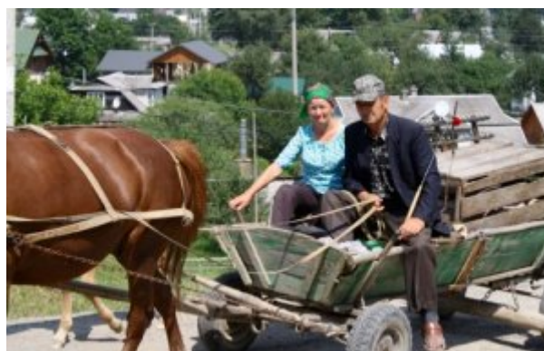
Ukraine, Carpates, retour du marché de Verkhovyna

A l'écart de Verkhovyna, cette maison rurale comme des milliers d'autres semble vivre dans un autre temps, sur un autre rythme.