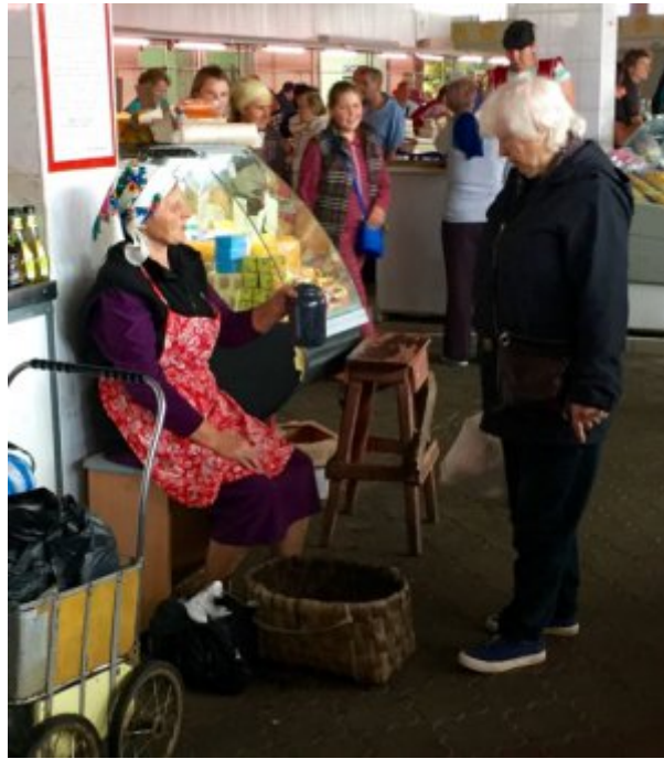
Ukraine, Lviv, marché près de la gare ferroviaire.

Et pendant ce temps, la vie continue. Mieux remplis qu'à l'époque soviétique, les marchés présentent des scènes récurrentes, comme cette femme âgée qui améliore son ordinaire en patientant dans l'espoir de vendre un pot de confiture maison.