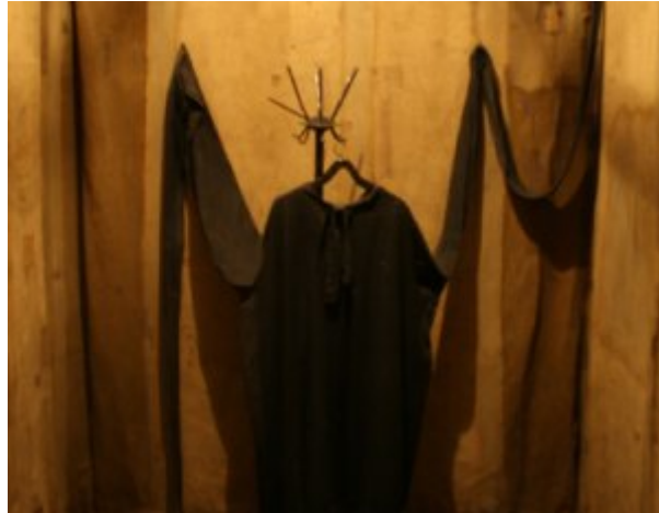
Lituanie, Vilnius, KGB

Lituanie, Vilnius, prison du KGB, cellule de torture.