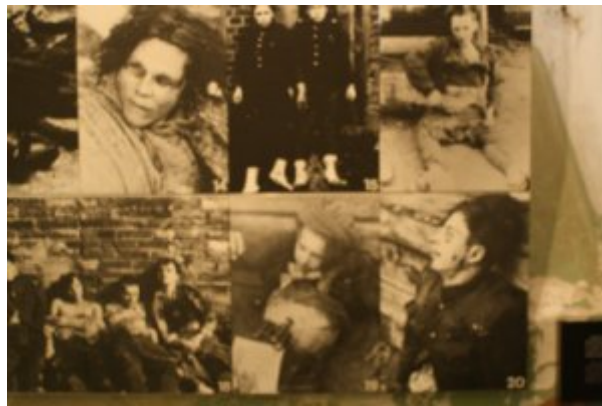
Lituanie, Vilnius, torturés par le KGB

Lituanie, Vilnius, prison du KGB, cellule de torture.