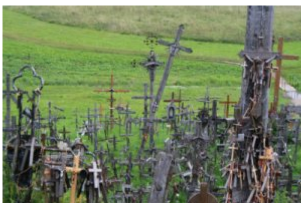
Lituanie, colline des croix

Lituanie, hommage à la musique, au milieu des champs.