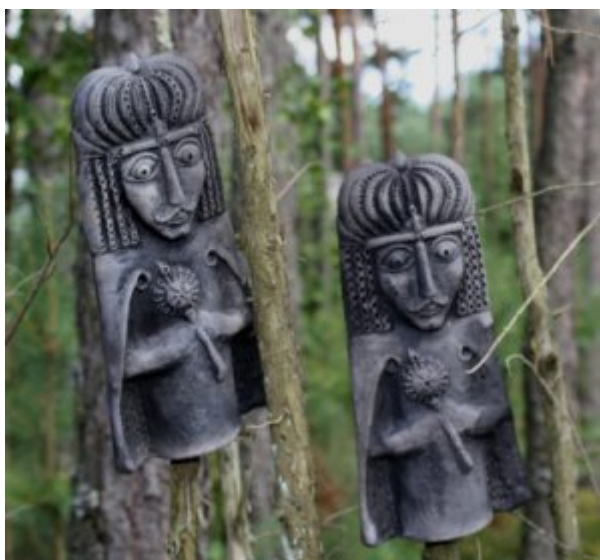
Lituanie, au milieu de la forêt

Lituanie, au milieu des bois... les esprits veillent.