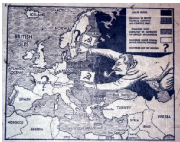
L'URSS de Staline met la main sur l'Europe de l'Est

Ce 1er janvier 2015 est aussi l'occasion de montrer avec quelques photographies la remarquable capacité de résilience de la Lituanie . Voici un pays martyrisé par Moscou, torturé par le KGB, déporté jusqu'en Sibérie... qui a su se reconstruire, se redresser et marcher debout. Ces quelques photographies veulent témoigner de ce qui reste d'une certaine manière un mystère.