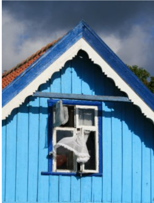
Lituanie, péninsule de Courlande