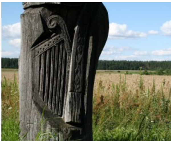
Lituanie, hommage à la musique

Lituanie, hommage à la musique, au milieu des champs.