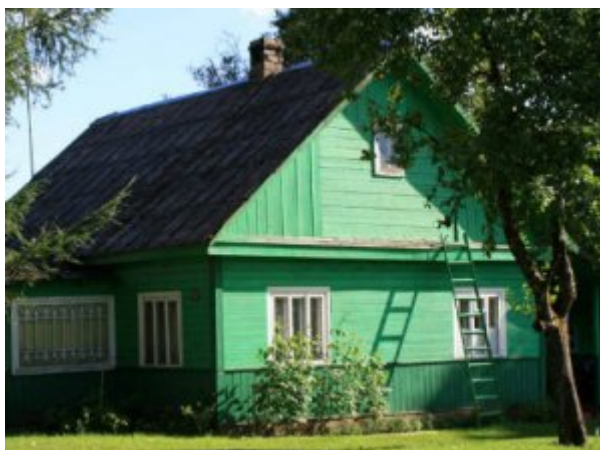
Lituanie, maison de bois