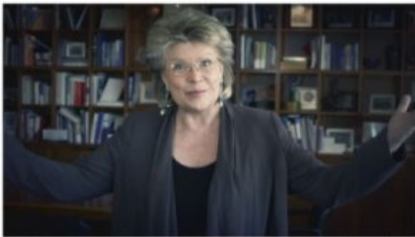
Capture d'écran de la vidéo officielle de bienvenue à la Croatie dans l'UE, 30 juin 2013.

Elargissement de l'UE. La Croatie est le 28ème membre de l'Union européenne à laquelle elle adhère le 1er juillet 2013. La Croatie représente 1,26% de la superficie de l'UE28, 0,86% de sa population mais seulement 0,33% de son PIB.